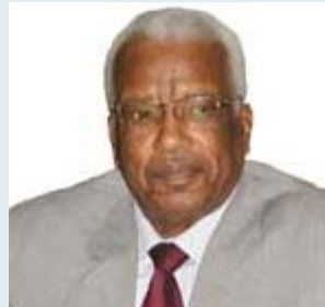
د. محمد خير الزبير محافظ بنك السودان المركزي