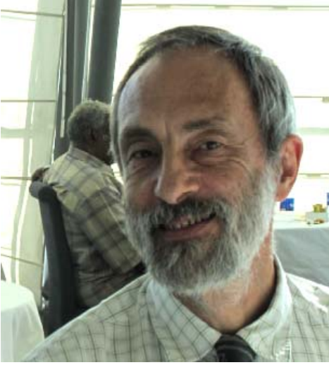
مدير التعاون التنموي بالاحصاء النرويجي

زار وفدًا من جهاز الاحصاء النرويجي السودان للتباحث والتفكير حول سبل التعاون مع الجهاز المركزي للاحصاء وتقديم الدعم والمساندة الفنية في الفترة المقبلة. وقد التقى الوفد بالفريق الفني للاستراتيجية الوطنية لتطوير الاحصاء واستمع لمخلص عن عملية تصميم الاستراتيجية وماتبقى من أنشطة حيث تم تسليم المسودة الاولى للاستراتيجية والتي ستناقش في اجتماع الشركاء لإبداء الملاحظات والتعليقات حولها ومن ثم إدخال ما سيتم الاتفاق حوله وتسليم المسودة الاخيرة لعرضها على جهات الإختصاص الرسمية لإجازتها.