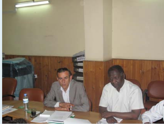
اجتماع منظمة الاسكوا

”اتخاذ قرارات سليمة يعتمد على بيانات تجمع وتحلل وتنتشر وفقاً للمبادئ الاساسية للاحصاءات الرسمية ومعايير جودة البيانات الدولية“