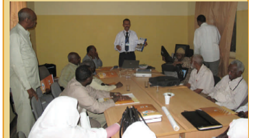
اجتماع الفريق الفني بلجنة الاستراتيجية الإحصائية بولاية كسلا

اجتمع فريق العمل الفني بلجنة إستراتيجية الإحصاء بالولاية وتم عرض الأوراق الفنية الضرورية و نقاشها ومد اللجنة بالوثائق اللازمة.