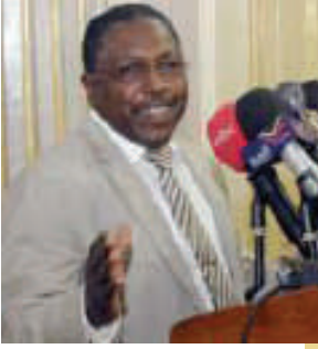
السيد/ وزير مجلس الوزراء