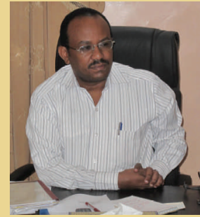
السيد/ مدير عام وزارة الصحة ولاية كسلا

وقد وضح أن إنعدام الإحصائيات هو العائق الرئيسي للتخطيط واتخاذ القرار السليم وصياغة السياسات، وعبر السيد/ المدير العام لوزارة الصحة بكسلا عن إلتزامه ودعمه لعملية وضع الإستراتيجية الإحصائية ووافق علي إستضافة الورشة الفنية المقترحة للجان إستراتيجيات الإحصاء الولائية.