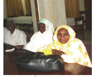
الاجتماع التنويري الفني لمديري مكاتب الجهاز المركزي للإحصاء بالولايات