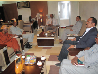
لقاء السيد/ وزير المالية والإقتصاد - ولاية نهر النيل