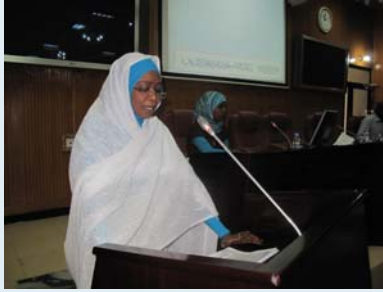
بنك السودان المركزي